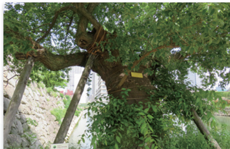
広島城二の丸のマルバヤナギ(2017年5月)