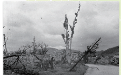
広島城二の丸のユーカリとマルバヤナギ(1945年10月)