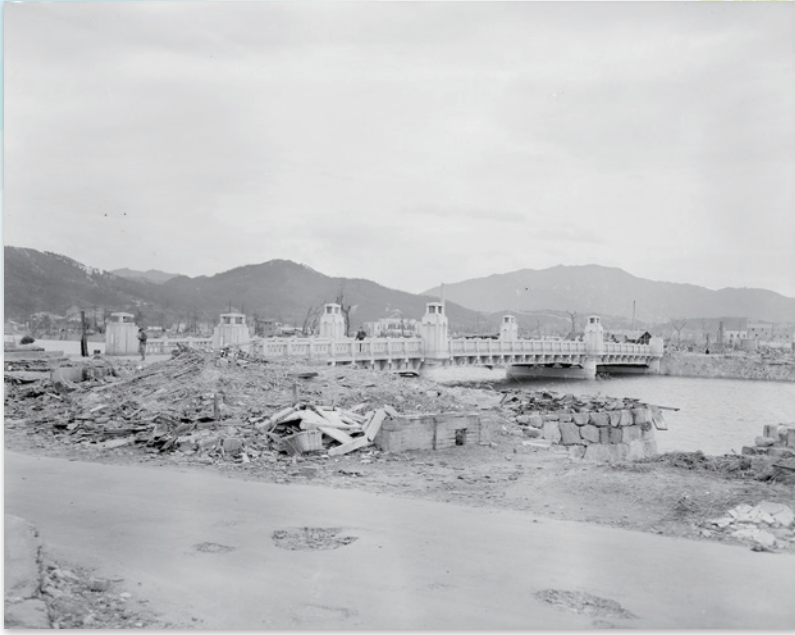
京橋(1945年11月頃)