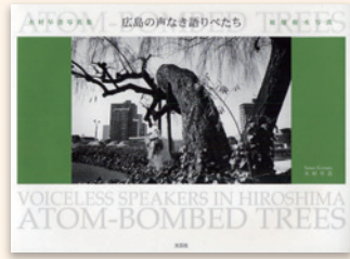
『広島の声なき語りべたち』 木村早苗／著 文芸社 2008年