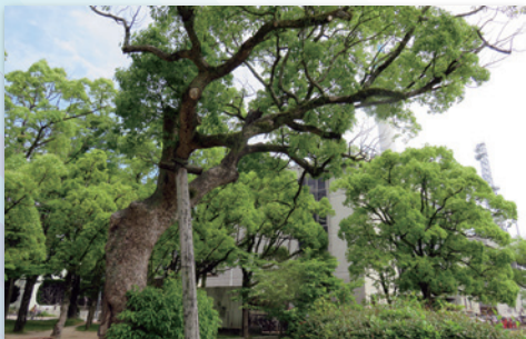
広島城お堀端、RCC北西のクスノキ(2017年5月)