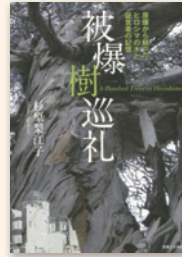
『被爆樹巡礼』 杉原梨江子／著 実業之日本社 2015年