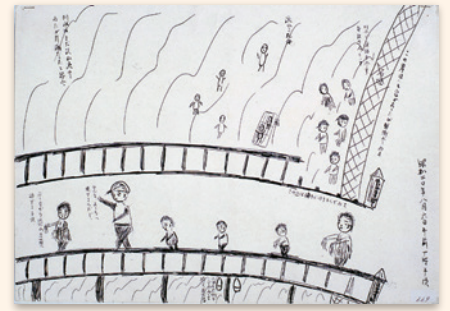
『市民が描いた原爆の絵』(比治山橋) 落合フミコ／画