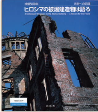
『ヒロシマの被爆建造物は語る』 被爆建造物調査研究会／編 広島平和記念資料館 1996年

被爆の惨禍に耐え、現存する被爆建造物は、被爆の惨状と、復興へと立ち上がる広島市民の暮らしや町の様子を見届けてきました。今年度の企画展では、被爆建造物のなかでも被爆橋梁と被爆樹木に焦点をあて、写真集や記録などの資料を展示します。