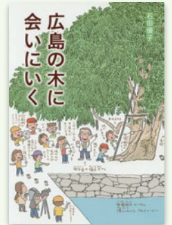
『広島の木に会いに行く』 石田優子／著 偕成社 2015年